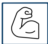
LEISTUNG 1.8 kW ✓