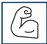
LEISTUNG kw ✓