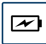
Energieversorgung mit Batterien hoher Kapazität ✓