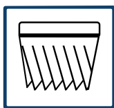
Mehrstufiges Filterungssystem ✓