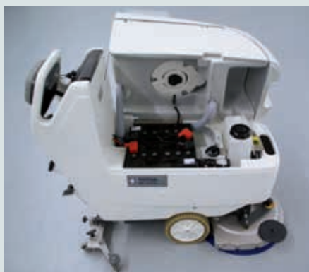
Alle technischen Komponenten sind leicht zugänglich. Einfache Befüllung des Ecoflex™-Systems. Extra geräuschkundig für leise Anwendungen.