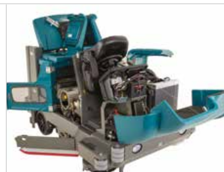
Das Design für einen einfachen Zugriff