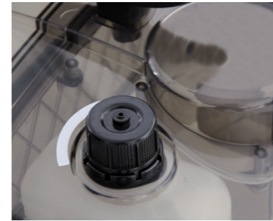
Ein separater Tank ermöglicht den Betrieb mit Entschäumer und garantiert damit ein kontinuierliches Arbeiten.