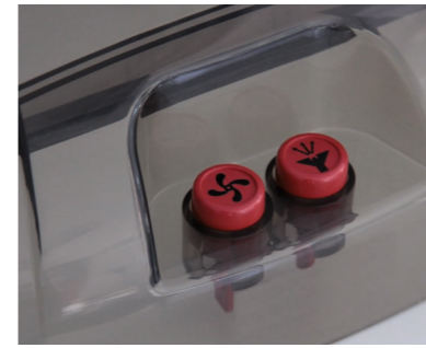
Sprüh- und Saugfunktion sind einzeln am Gerät zuschaltbar.