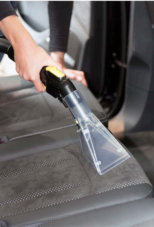
Glasklare Polster-Sprühdüse zur Reinigung von Polstermöbeln oder Fahrzeugsitzen. Ergonomischer Handgriff mit handlichen, bequemen Bedienelementen. Die Sprühfunktion ist per Bedienelement am Handgriff dosierbar.