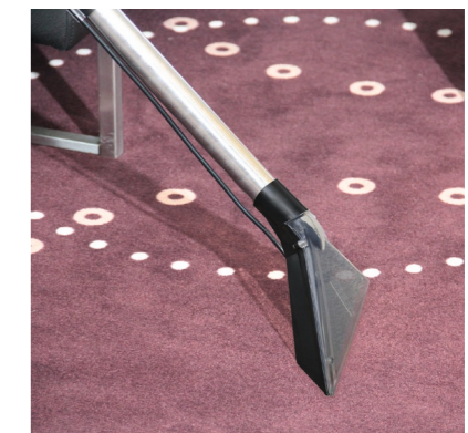
Glasklare Bodendüse mit langem Saugrohr zur bequemen, ermüdungsfreien Teppichreinigung.