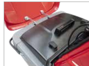
Großer frontaler Staubbehälter